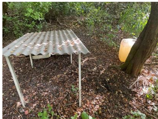
Illustration point d'eau territoire de Vicq