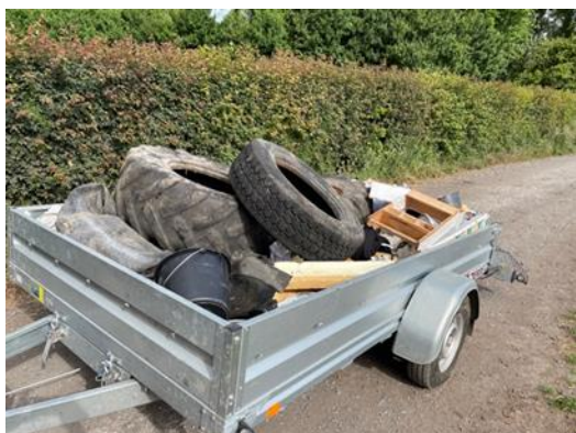
Illustration journée nettoyage des chemins de Vicq

Président de la Société de Chasse du Territoire de Vicq