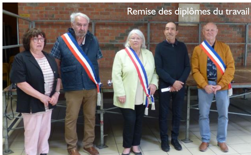
Remise des diplômes du travail